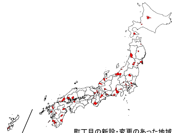
町丁目の新設・変更のあった地域を色塗り表示しています。 TerraMap Ver.13 は対応済みです。

「富士見町3丁目」「広尾1丁目」など「●丁目」で表わされることが多く、エリアマーケティングにおける行政界の最小単位。 出店の際の商圈調査（特に小商圈および駅前立地の店舗）、ハフモデル分析、顧客のマッピングやシェア分析、 また、ポスティングなど販促エリアの選定には、必ず使用する行政界です。