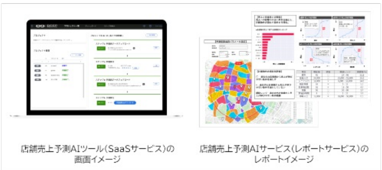
店舗売上予測AIツール(SaaSサービス)の画面イメージ

小売業・飲食業・サービス業のお客さまが保有する既存店舗の情報や売上などのデータをもとに、出店候補物件の売上金額をAIを用いて高精度に予測し、データに基づいた出退店判断を支援するソリューションです。AI CROSSが開発・提供するノーコードAI予測分析サービス「Deep Predictor(ディープ・プレディクター)」を中核としており、出店頻度や分析実施体制に応じて、「店舗売上予測AIツール(SaaSサービス)」と「店舗売上予測AIサービス(レポートサービス)」の2つの形態から選べます。