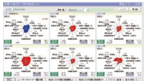
候補物件商圈の商圈力に商圈の特性と商圈のパワーが最も類似する既存店商圈を一発検索した画面です。