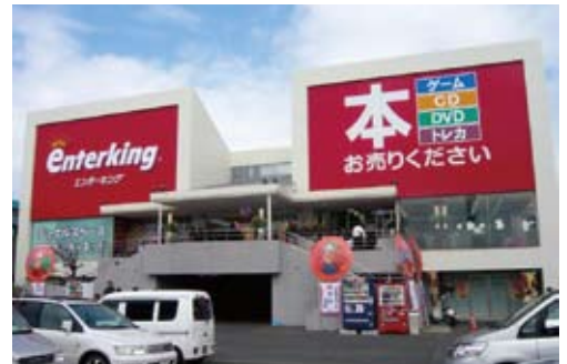
「エンターキング」。中古新品を問わず、ゲーム・DVD・CD・コミック・雑貨など多種多様な商材を取り扱う、いわゆる複合リサイクルショップです。