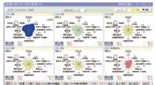
候補物件商圈の商圈力と既存店の商圈力を格付け「ランキング」で検索した画面です。候補物件の商圈力が既存店のどのランクになるか可視化。